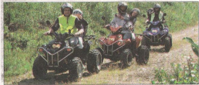
Fyrhjulingssafari har blivit det populäraste nöjet.