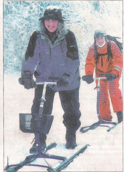
... och vintertid går det att hyra kicksparkar. Sätter man skidor på dem går det undan på snön.

många vill ha menar de. Variation. De vill satsa på annor-