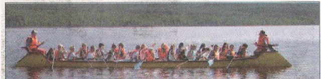
Årets nyhet är en elva meter lång 22-mannakanot.